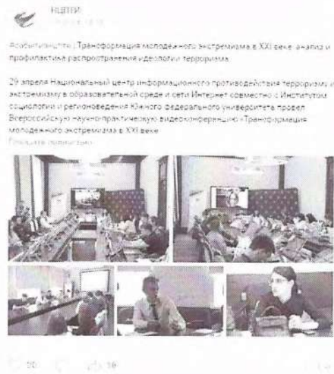
Рисунок 12 – Информация о прошедшем мероприятии