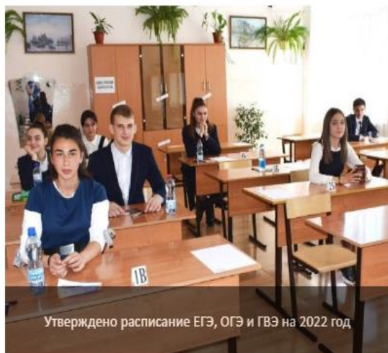
Утверждено расписание ЕГЭ, ОГЭ и ГВЭ на 2022 год

О РОСОБРНАДЗОРЕ ▾ ГОС. УСЛУГИ И ФУНКЦИИ ▾ ДОКУМЕНТЫ ▾ ОТКРЫТАЯ СЛУЖБА ▾ НАВИГАТОР ГИА ▾ ПРЕСС-СЛУЖБА ▾